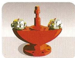
Bajo nivel de tierra

Diseñado para cuando hay problemas de espacio, como en las aceras de las grandes ciudades. Al permanecer bajo tierra, el riesgo de daños por heladas es mínimo.